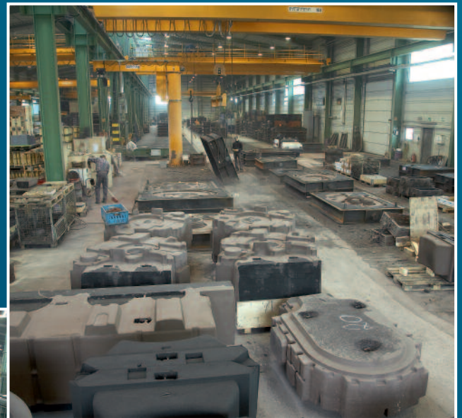
Die 1.800 m 2 große Handformerei The moulding shop (1.800m 2 )