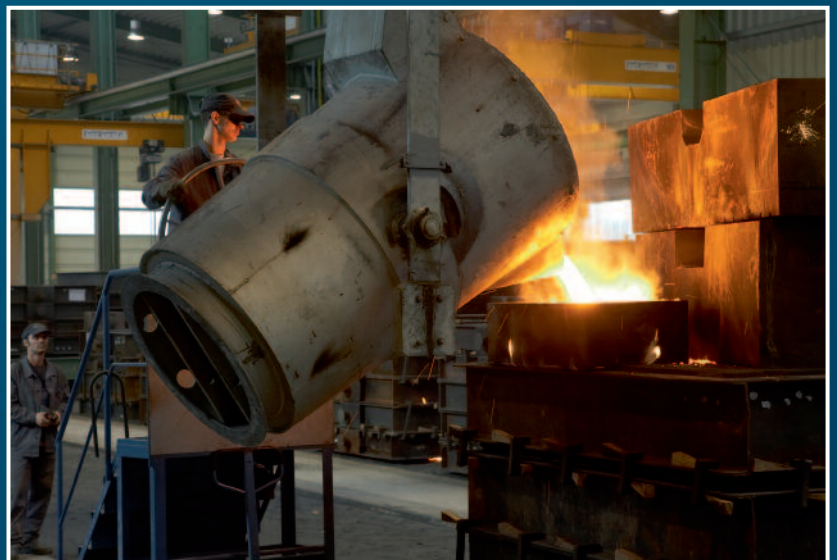
Herstellung von Gussteilen von 500 kg bis 8.000 kg Production of castings from 500 kg to 8.000 kg