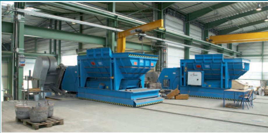
Computerunterstütztes Chargieren und Gattieren Computer-assisted charging