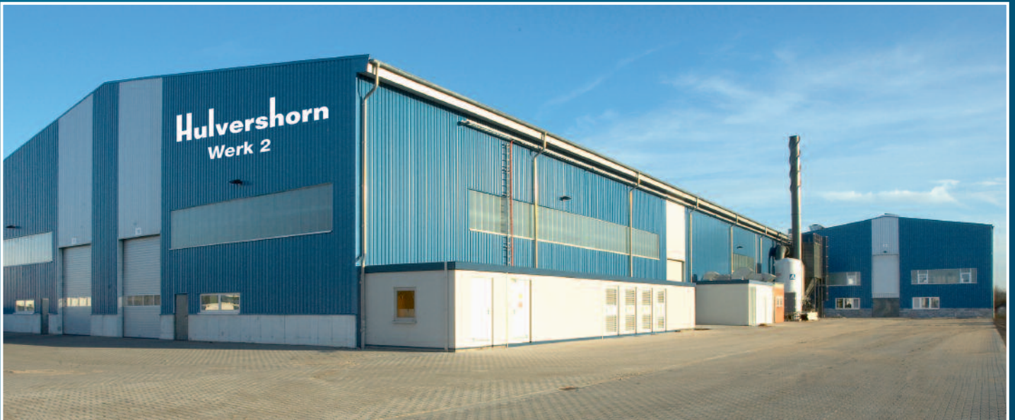
Außenansicht der Gießerei (Werk 2) External view of the foundry (plant 2)