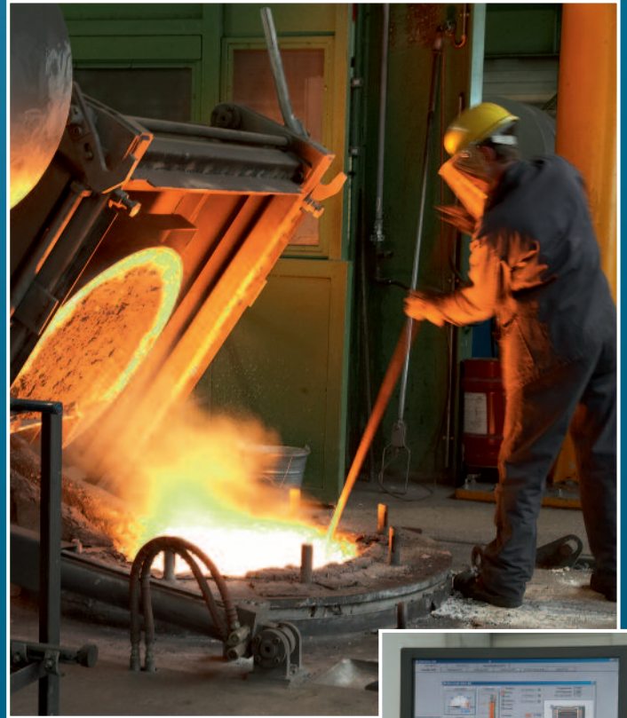
Schmelzen in zwei 4t Mittelfrequenz-Induktionsöfen Melting in two 4t mid-frequency induction furnaces