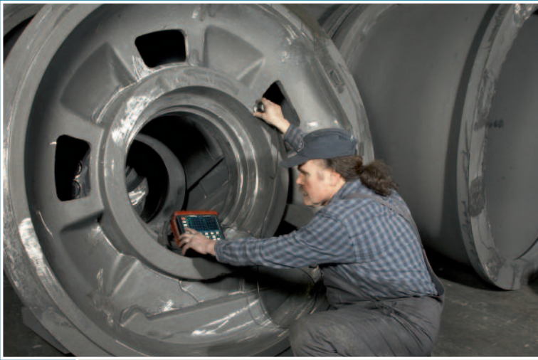
Ultraschallprüfung von Gussteilen Ultrasonic test of castings