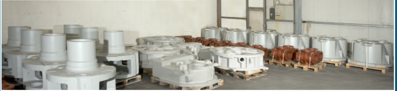
Witterungsgeschützter Verladebereich Enclosed dispatch area