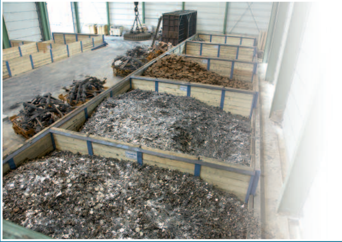
Lagerung der metallischen Einsatzstoffe Storage of the raw materials