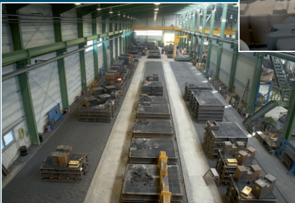
Gießfertige Formen auf den Gießbahnen (3,5 m x 78 m) Prepared moulds in the casting area (3,5 m x 78 m)